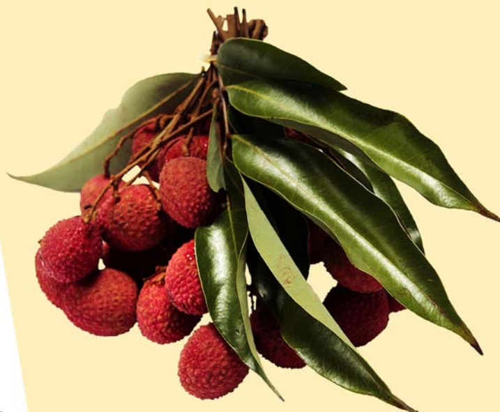
Litchi avion de la Réunion Evolution du prix import moyen en France (en euros/kg par semaine)

Les ventes ont été difficiles pour les fruits frais envoyés par avion en raison de leur disparité qualitative. Certains lots d'arrivage et a fortiori de resserre présentent une qualité variable avec une oxydation de la coque des fruits et le développement de taches. Ces produits, principalement écoulés sur les marchés de gros, sont proposés à des prix inférieures à ceux mentionnés ci-dessous (à partir de 4.00 euros/kg). Le marché du litchi avion est dominé par les envois de la Réunion, qui atteint cette semaine son pic de campagne. Celui-ci devrait se prolonger la semaine prochaine. Les fruits présentés en bouquet se sont vendus de 6.00 à 7.00 euros/kg en début de semaine et en augmentation en fin de semaine à 7.00-7.50 euros/kg, voire au-delà en raison d'une accélération de la demande. Les fruits branchés obtenaient parallèlement 5.00 à 6.00 euros/kg. Les fruits égrenés se sont, quant à eux, vendus sur une base de 5.50-6.00 euros/kg. Les prix soutenus de fin de semaine devraient se maintenir, voire progresser la semaine prochaine à l'approche des fêtes de fin d'année.